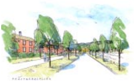
Björkrisvägen mot prästgården. Bild från skissförslaget.