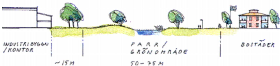
Principsektion genom parken enligt skissförslag mars 2002. Industribyggnader/kontor trappas ner i höjd så att byggnadshöjden motsvarar bostädernas.

Efter planteringszonen förslås en 50 - 75 m brett parkområde där den omdragna bäcken kommer att gå. Rätt utformad kan planteringszonen fungera som rekreationsområde för de boende. Bäckens liksom Kungsbackaån bör förstärkas med trädplantering, sk strandskog, som naturligt finns längs vattendrag. Bäckens bör anläggas med sluttningar på ca 1:3 bl a för att bli mer "barnsäker".