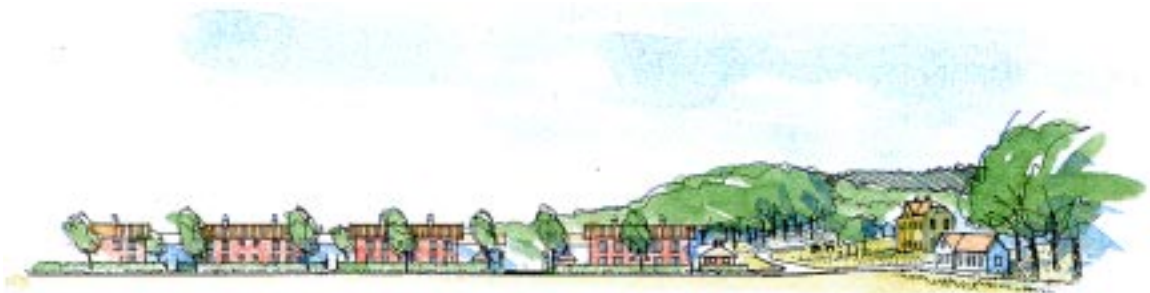
"Stadsfasad", området sett från Göteborgsvägen. Bild från skissförslaget

En ökad mängd bostäder ger en starkare identitet för bostadsområdet. Denna etapp kan innehålla ca 100-130 bostäder.