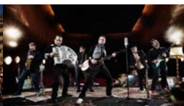
Andra Generationen 22.15