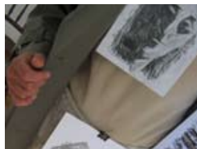
Blottarkonst runt om i stan