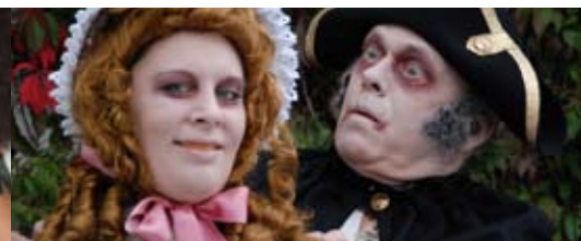
Spöknatta 20.00 & 21.00