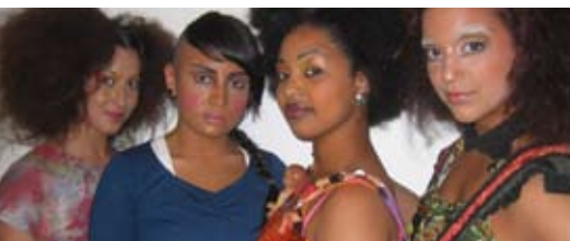
Lace Crew, Twisted Feet 18.30