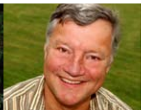
Opera Sing-a-long 20.30