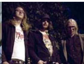
2 Cool 4 School 20.30