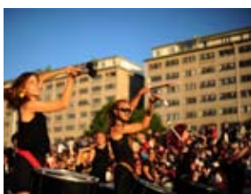
Kiriaka sambatåg från 17.45