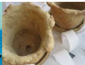
Konstmingel på Enmix