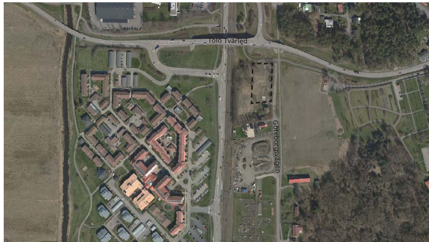
Planområdets läge intill Göteborgsvägen, strax söder om Tölö Tvärled