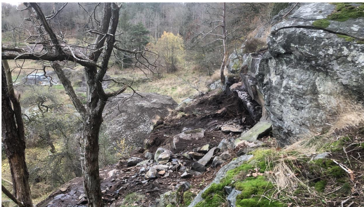
Figur 3 Berghylla där blockgrupp 1 tidigare var belägen