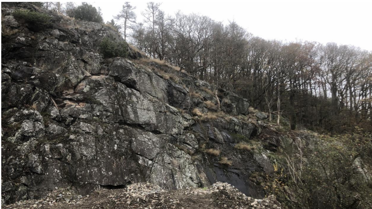
Figur 2 Slänt A efter utförda bergåtgärder