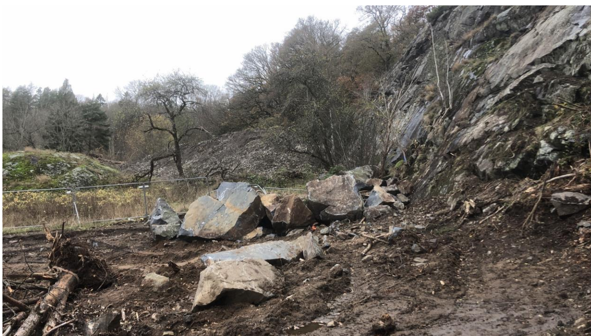
Figur 4 Block från blockgrupp 1. Observera storleken i förhållande till byggstaket i bakgrunden