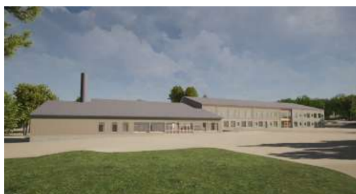
Vy från skolgården (ÅWL Arkitekter, 2024)