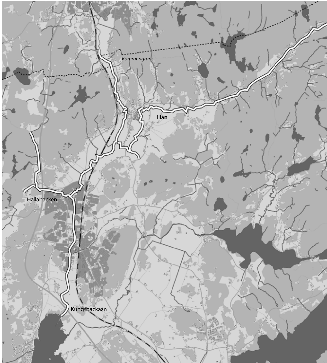
Skala 1:80000. Svinholmen 1:1 m.fl.