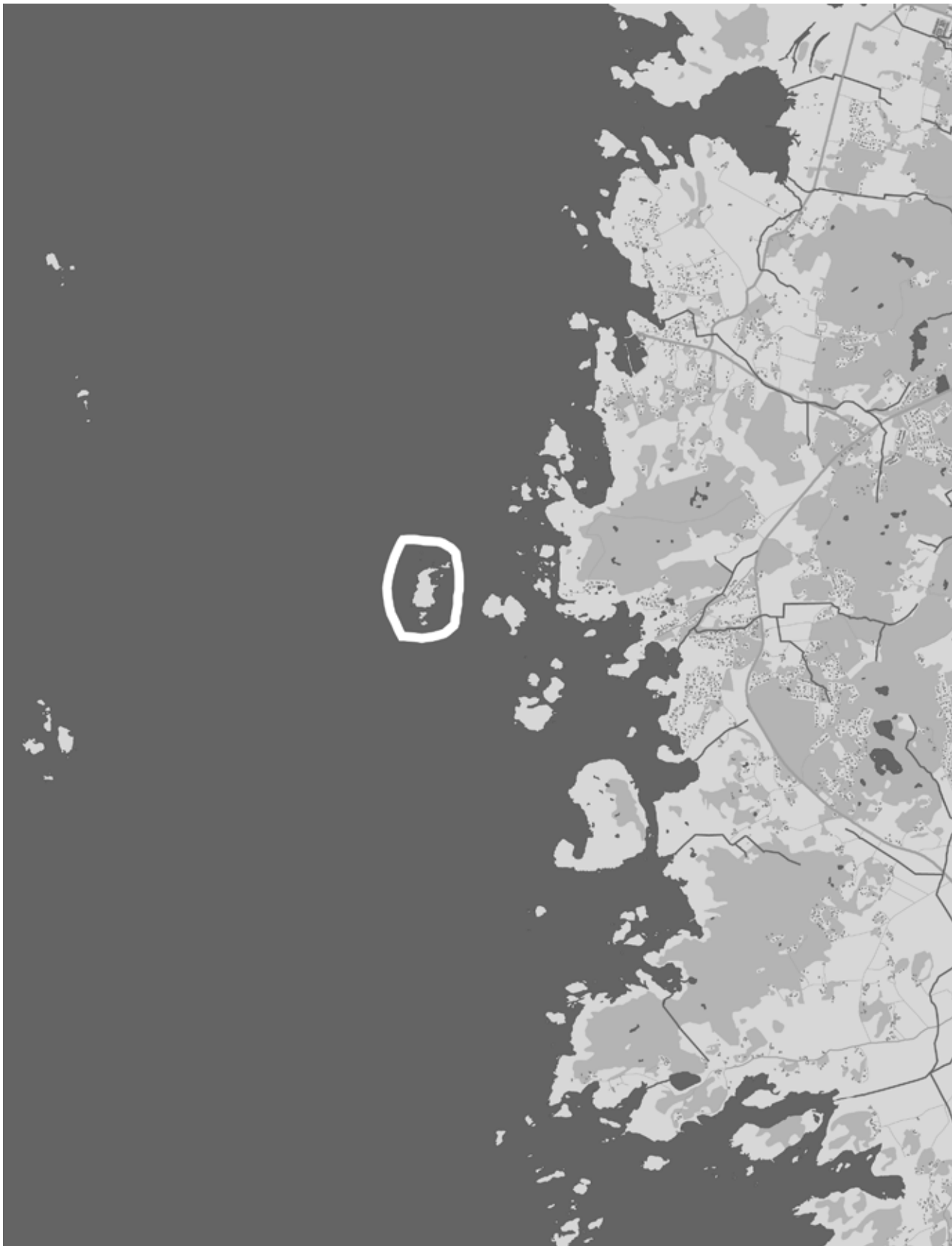
Skala 1:50000. Snäckan.