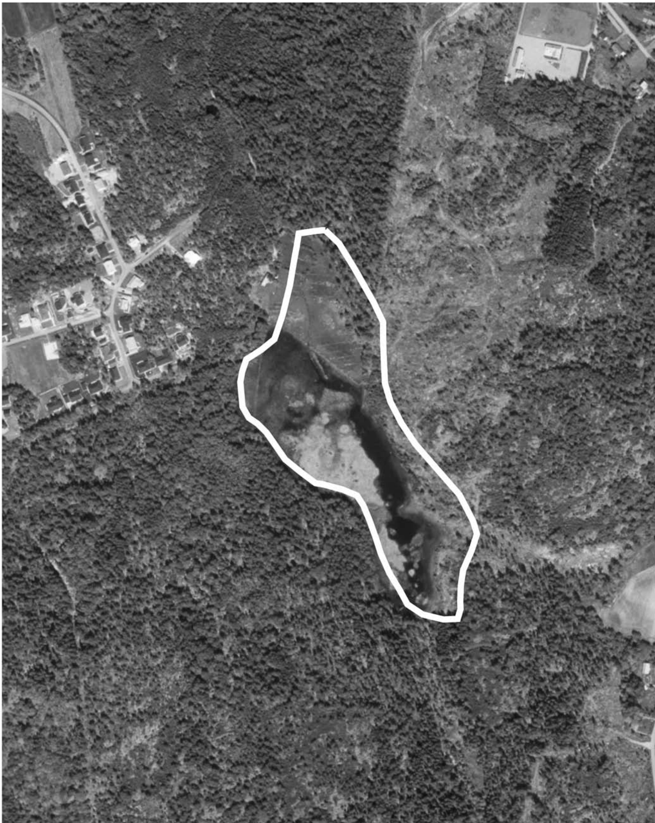
Skala 1:5000. Lunna 17:1 m.fl.