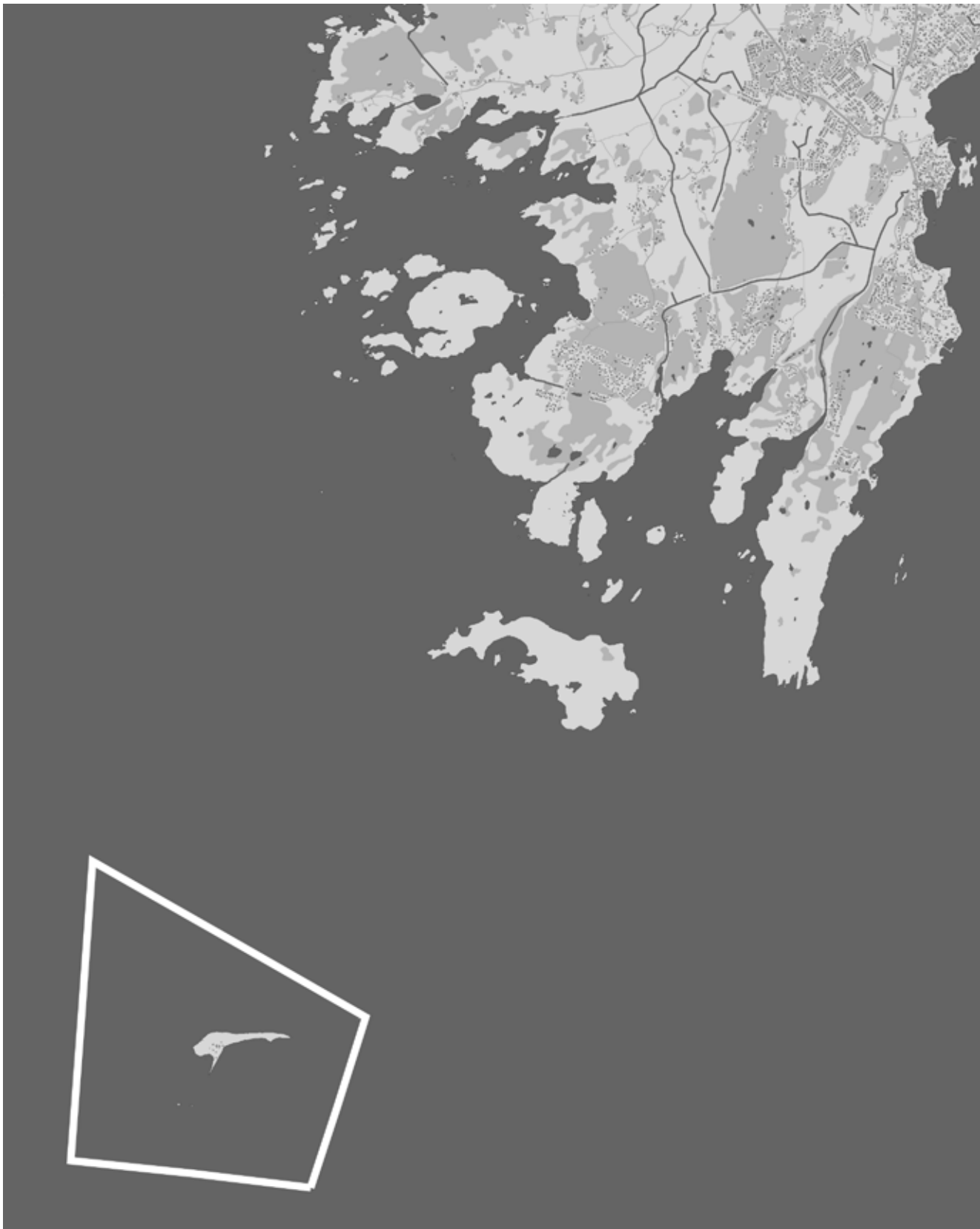
Skala 1:50000. Nidingen 1:1.