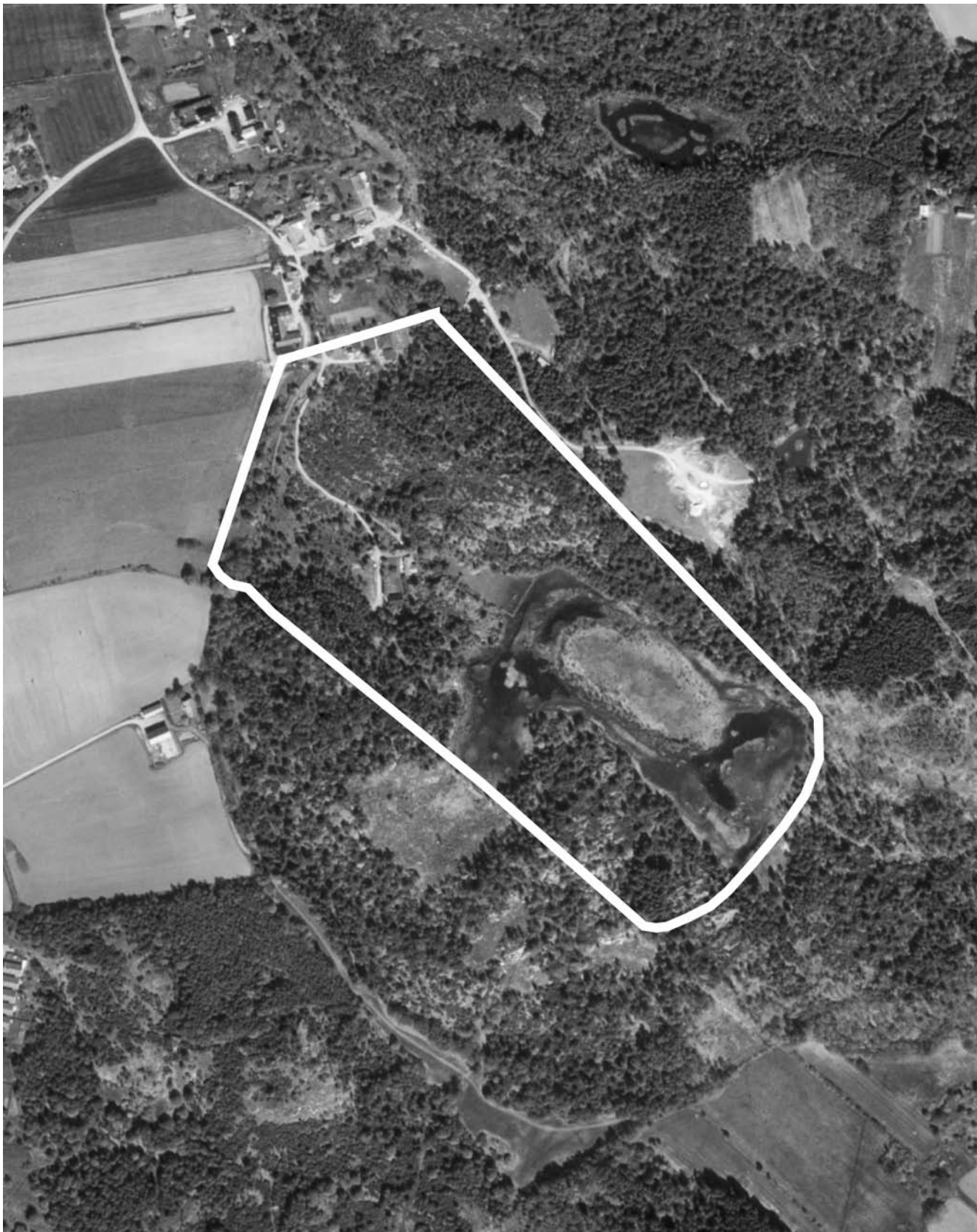
Skala 1:5000. Voxlöv 6:1 m.fl.