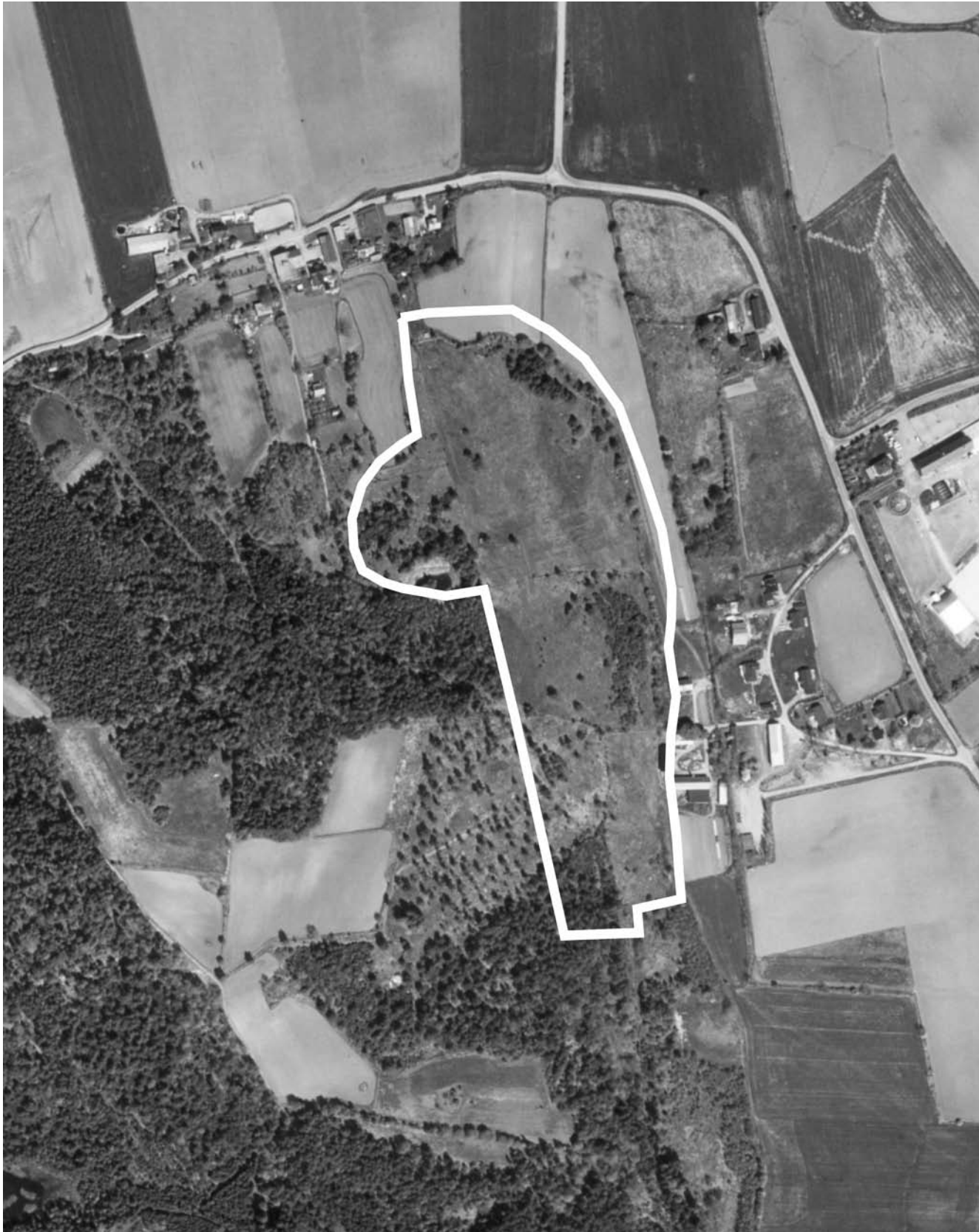
Skala 1:5000. Höglända 3:6 m.fl.