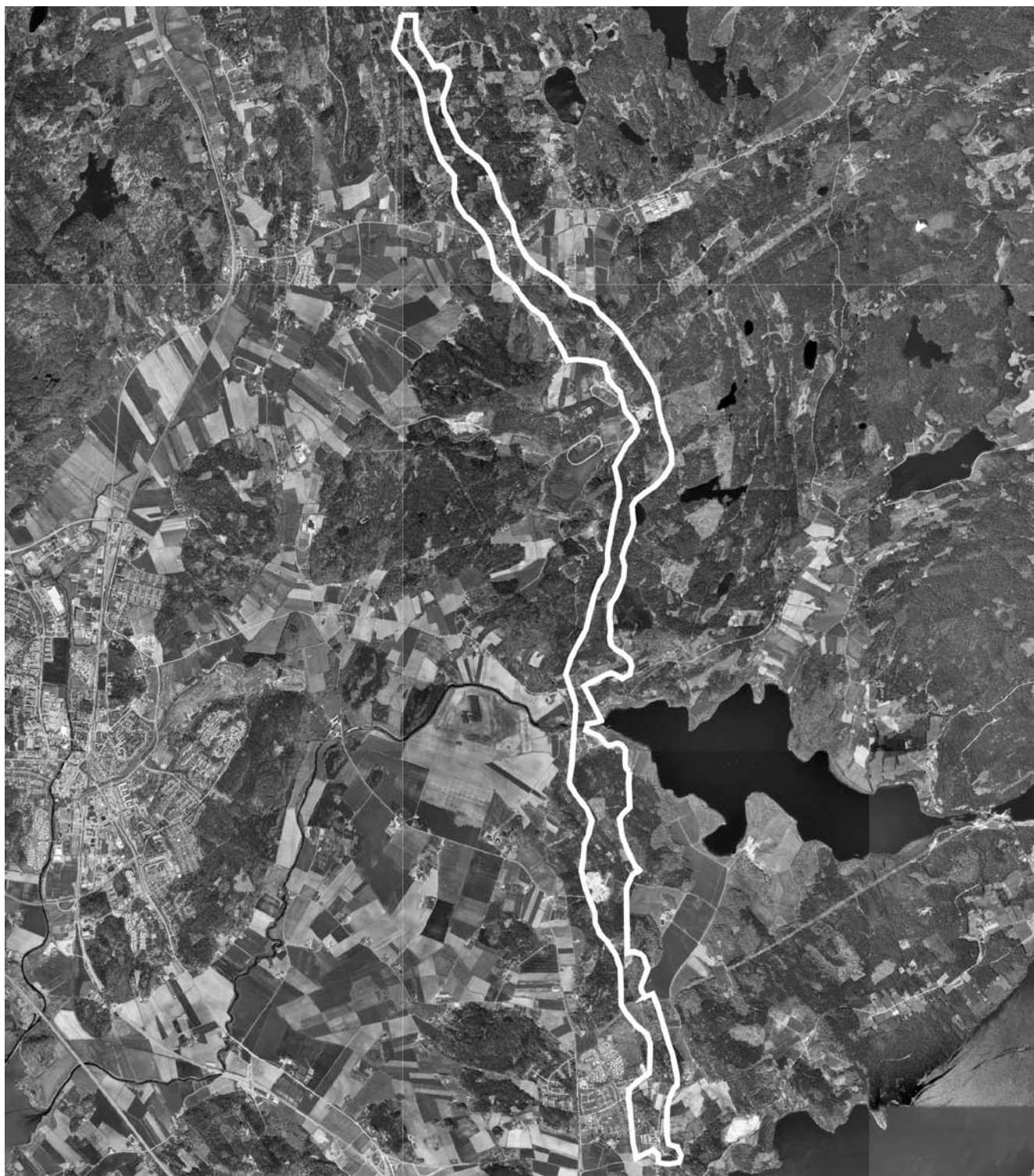
Skala 1:70000. Hjälm 15:1 m.fl.

Inga ytterligare täkter bör öppnas i området. Normalt jord- och skogsbruk.