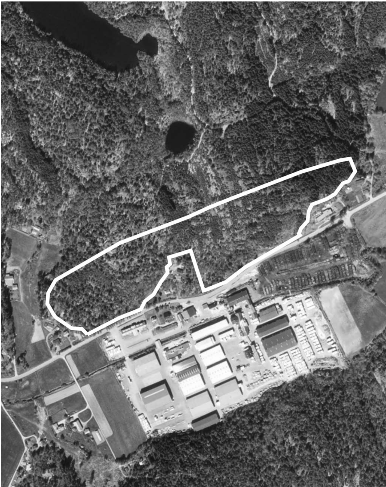
Skala 1:5000. Lerberg 19:1 m.fl.