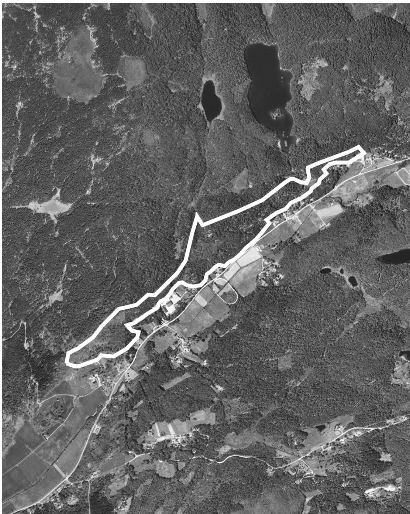
Skala 1:15000. Salvebo 3:1 m.fl.