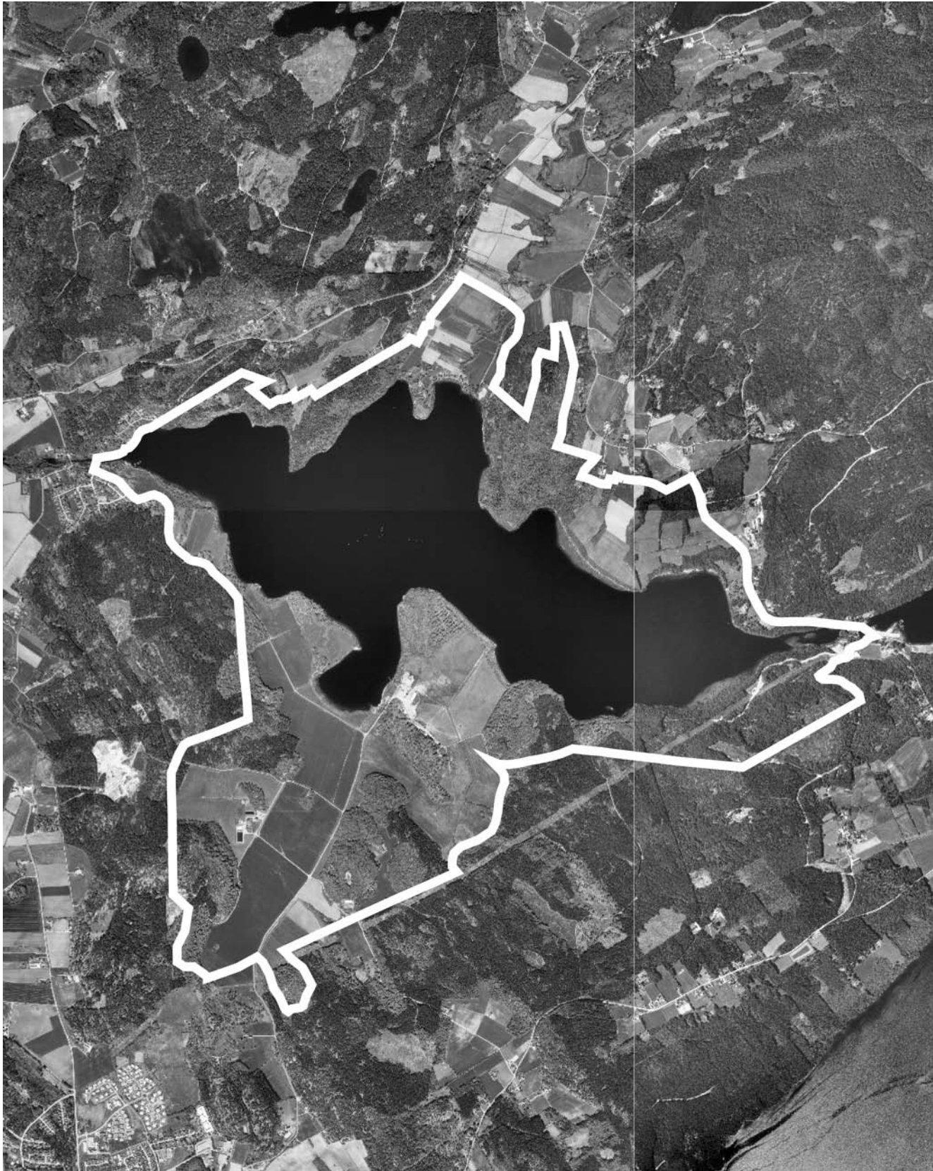
Skala 1:30000. Rossared 5:1 m.fl.