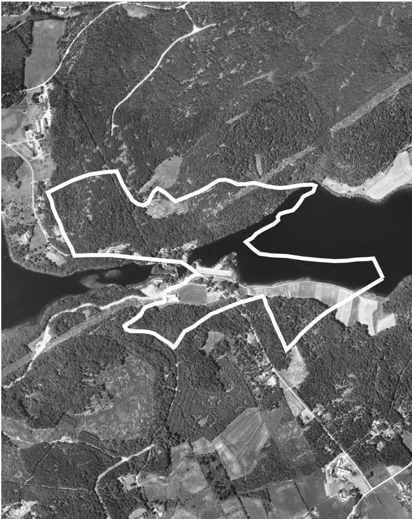
Skala 1:10000. Rossared 5:1 m.fl.