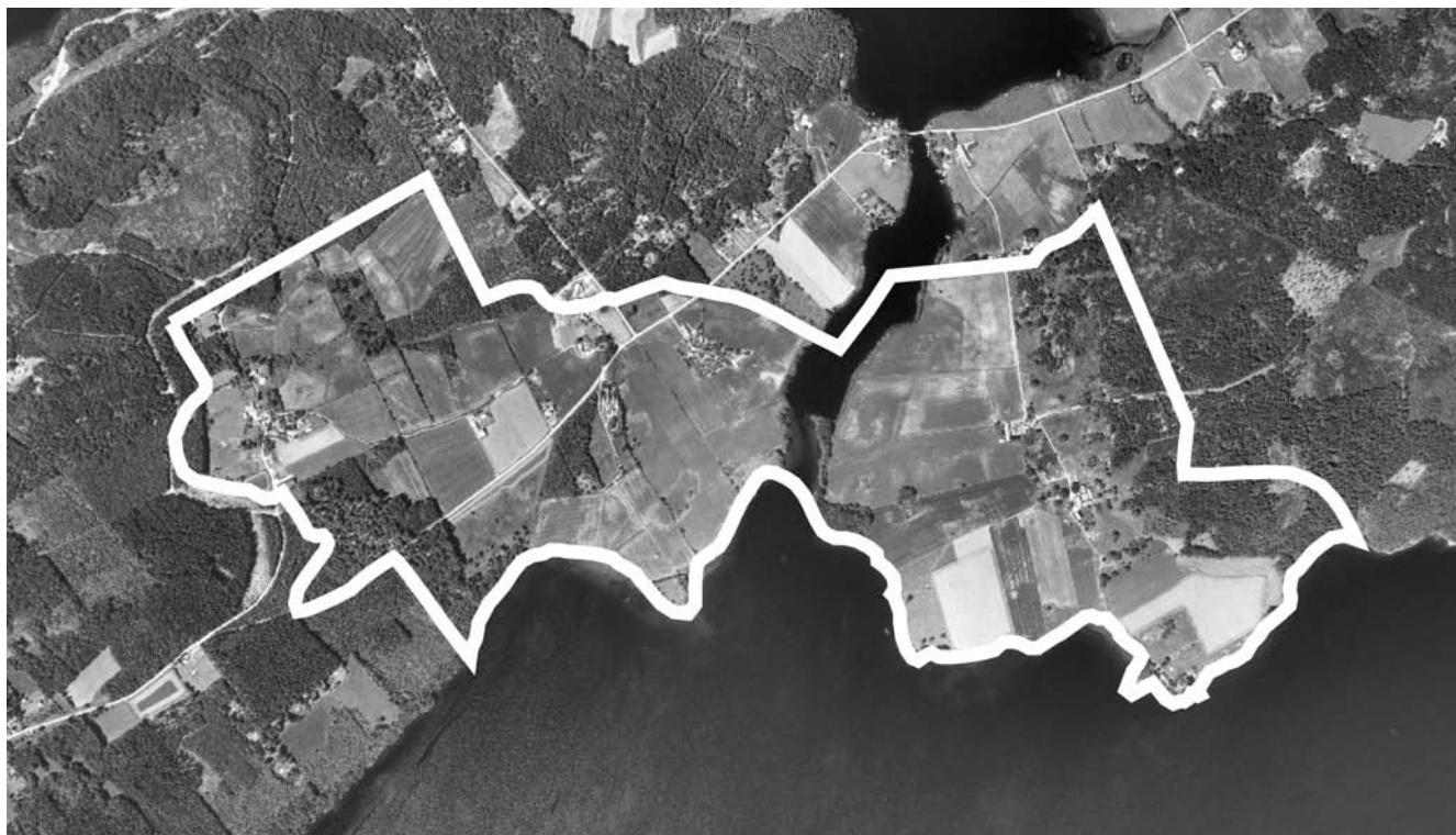
Skala 1:20000. Stormhult 1:3 m.fl.