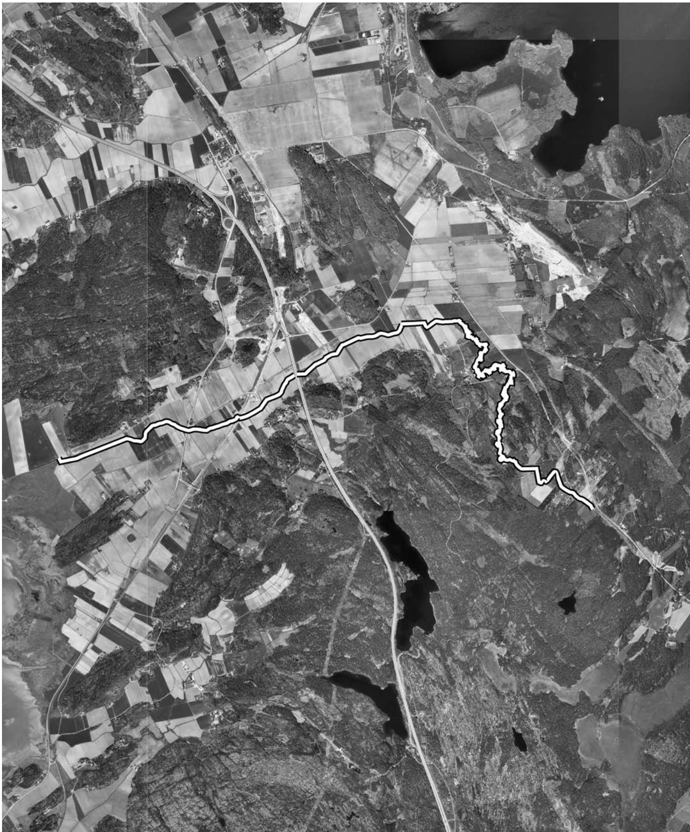
Skala 1:40000. Tjolöholm 1:1 m.fl.