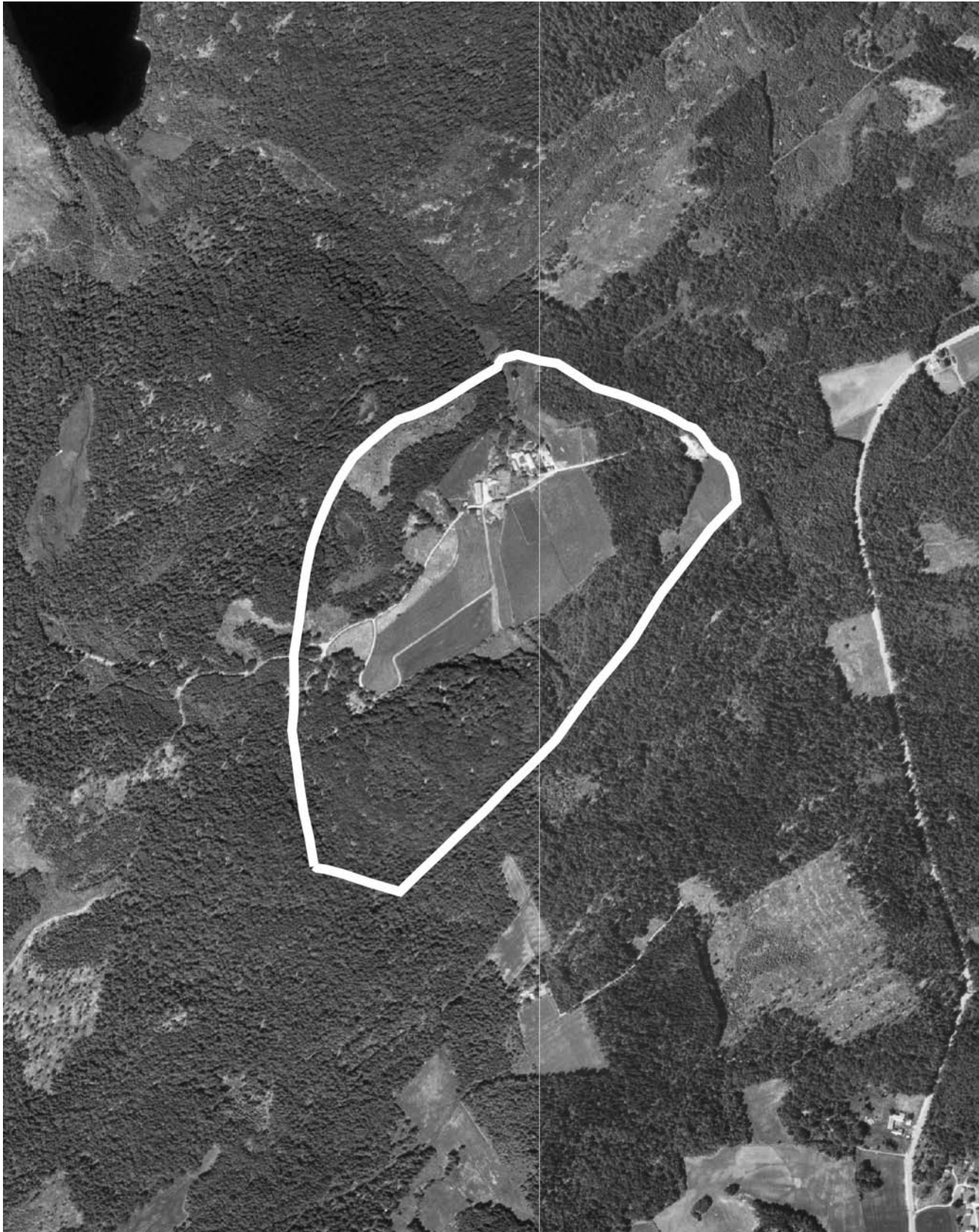
Skala 1:10000. Gränshult 1:3 m.fl.