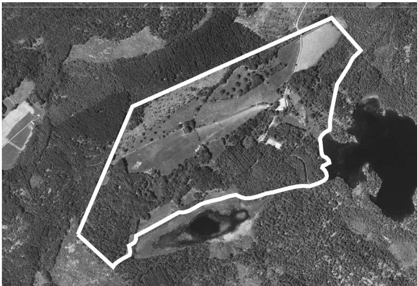
Skala 1:10000. Timmerås 1:2 m.fl.