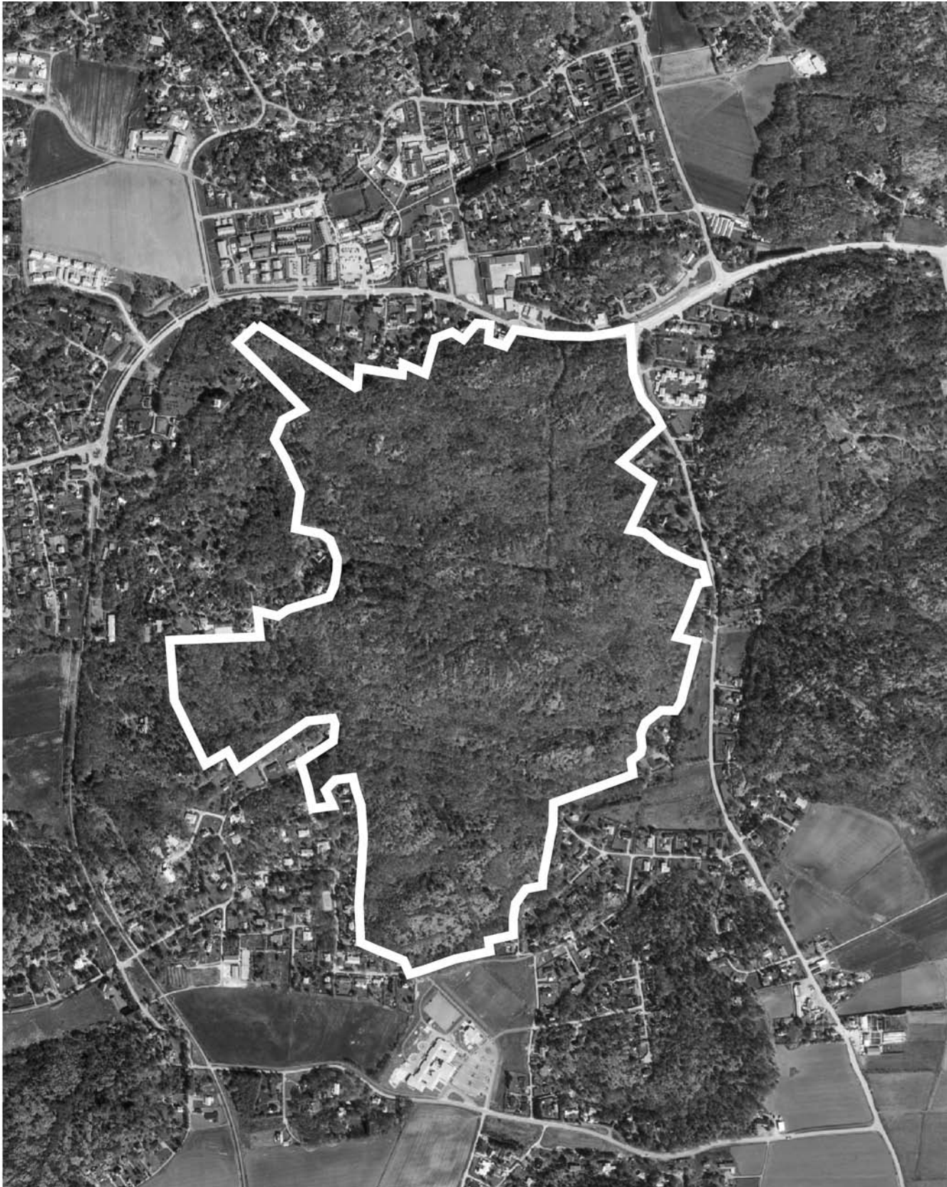
Skala 1:5000. Hålan 1:4 m.fl.